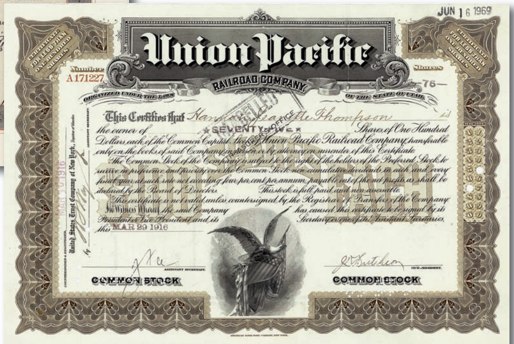
Los Nr. 963 Union Pacific Railroad, 1916 Startpreis: 1.500,- Euro Zuschlag: 2.600,- Euro