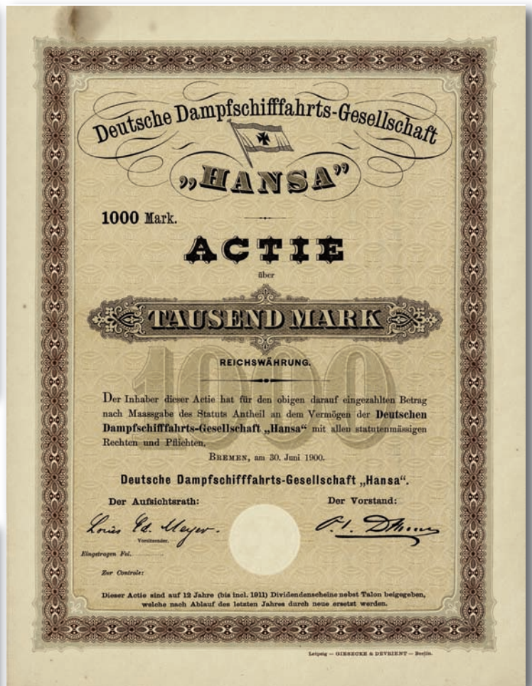
Los Mr. 114 • Deutsche Dampfschiffahrts-Gesellschaft, Hansa, Bremen, 1900 Startpreis: 1.500,- Euro Zuschlag: 2.400,- Euro