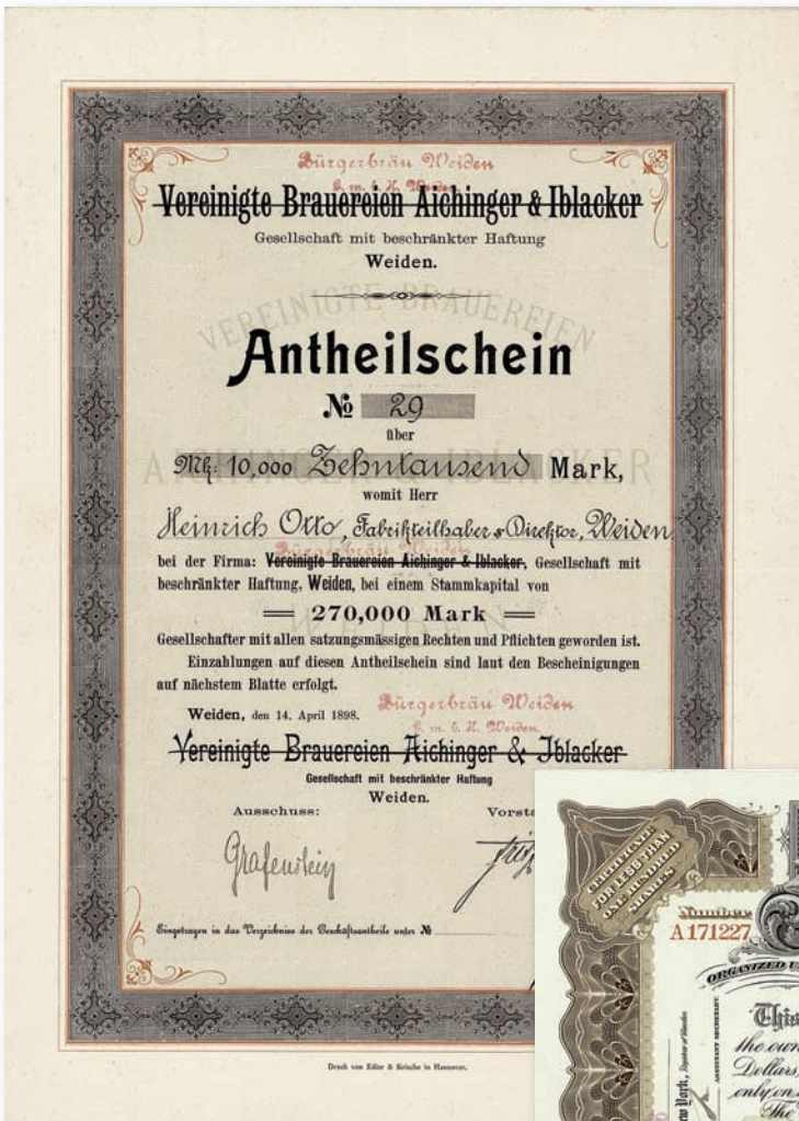
Los Nr. 460 • Vereinigte Brauereien Aichinger & Iblacker GmbH, Weiden, 1898 Startpreis: 650,00 EUR Zuschlag: 1.050,- Euro